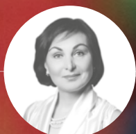
ГОД: 2019 г. Нижневартовск