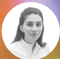
ГОД: 2017 г. Ярославль