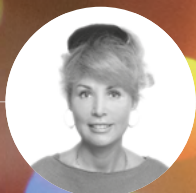
ГОД: 2015 г. Челябинск