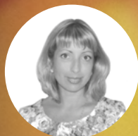
ГОД: 2016 г. Чаны