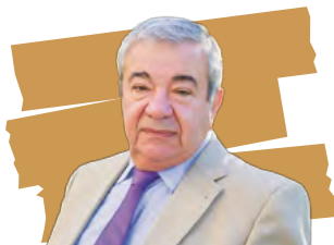
Засл. деятель науки РФ, член-корр. РАН, проф. В.Е. Радзинский (Москва)