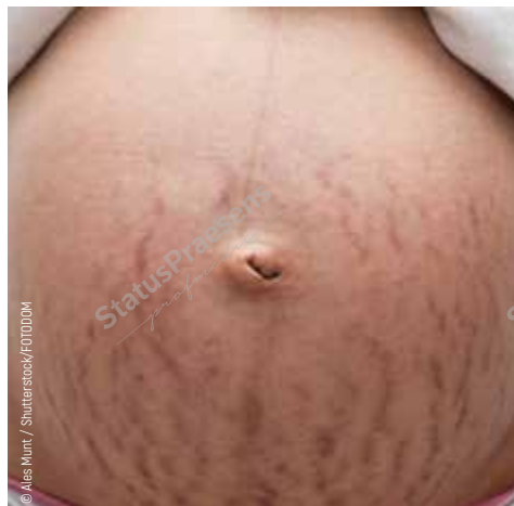
Рис. 2. Стрии (растяжки).