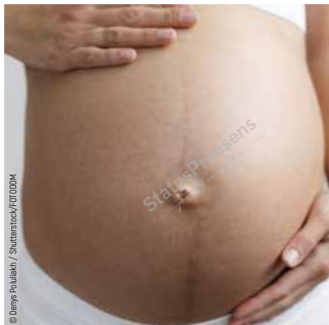
Рис. 1. Гиперпигментация белой линии живота.

С растяжением кожи может быть связан зуд , особенно в области живота и молочных желёз. Этот симптом возникает нечасто и обычно успешно купируется применением специальных средств для увлажнения и смягчения кожи. Кстати, эти же средства обычно помогают в борьбе с растяжками.