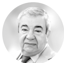
Радзинский В.Е. , засл. деятель науки РФ, член-корр. РАН, проф. (Москва)